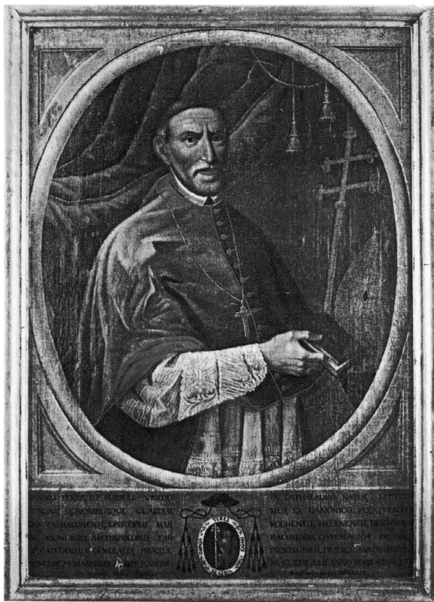
JOAN TERÈS I BORRULL, ARQUEBISBE DE TARRAGONA Reproducció del quadre pintat a oli, propietat de la família Company-Ventosa. DE TARRAGONA