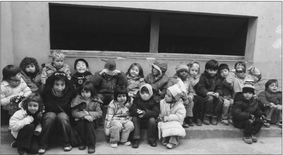
Alumnes del CEIP les Savines.