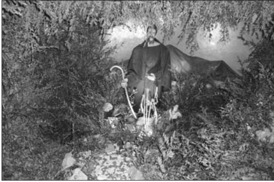
Imatge de la cova.