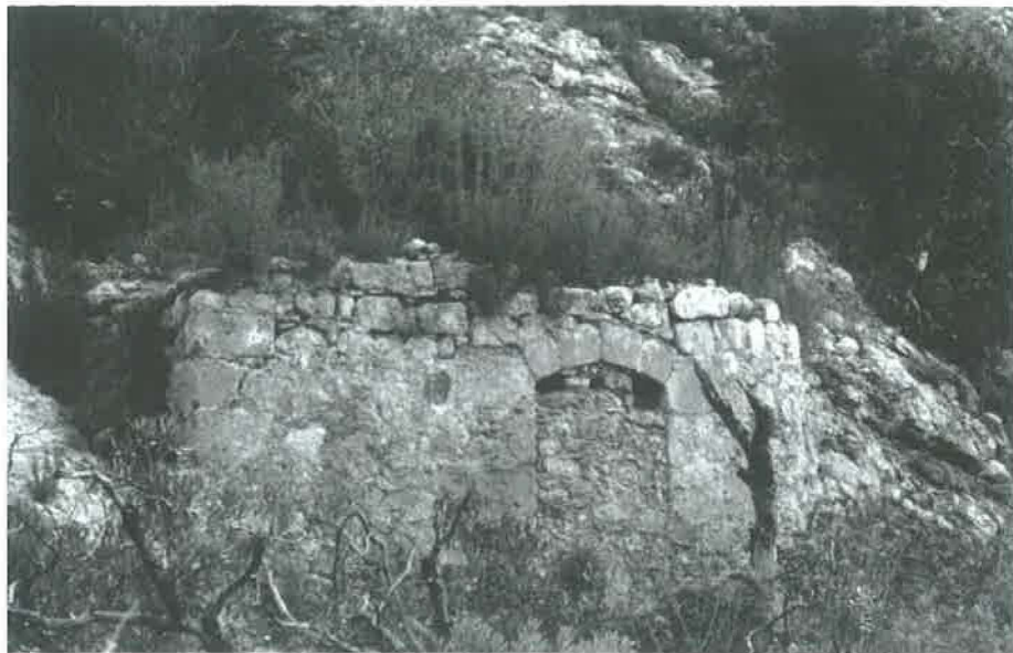
La Font Seca