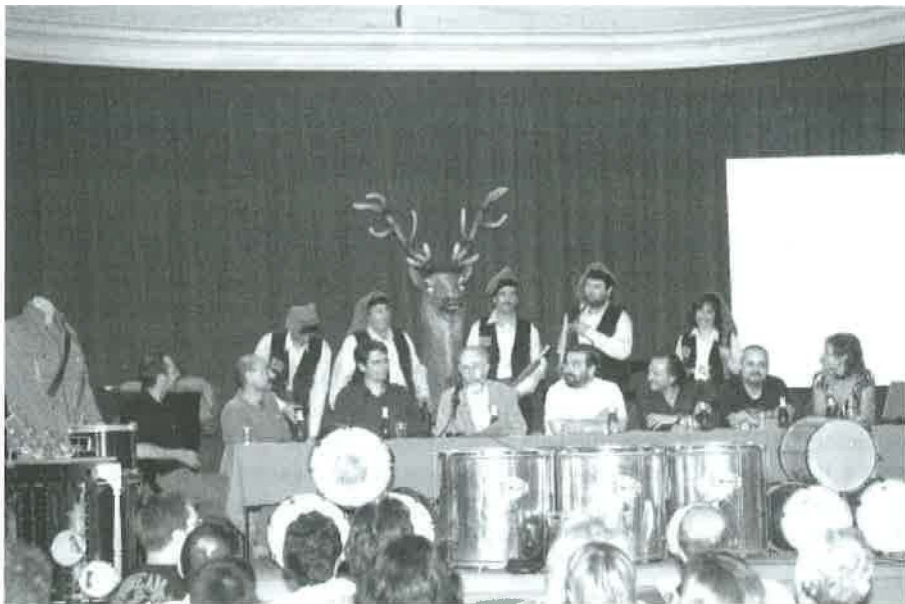
Presentació del CD, del cérvol Tibau i dels Trabucaires de Cervera, 6-7-2007