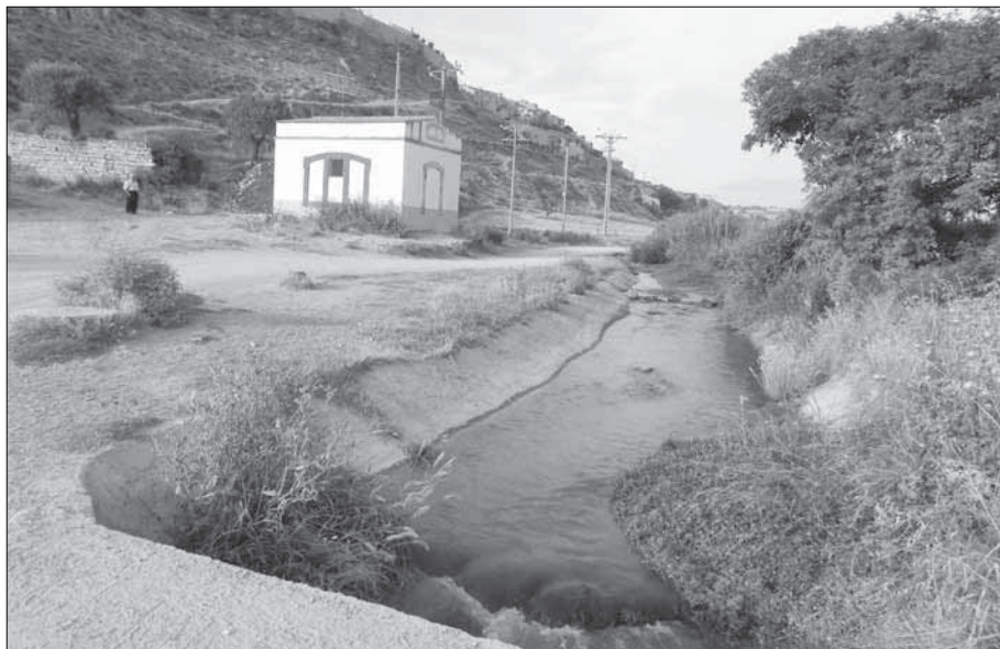
Els Pous.

dir tapar-la de terra, malgrat que allà a prop en queda un pou que, quan era de la família Duran, s'omplia amb una bassa quadrada on la família Duran, la família Camps i la família Solsona, hi anaven a nedar.