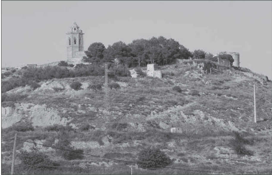
Font del camí de la Solana.

Després de la descripció i emplaçament, molt meticulós que l'Agustí va fer de les fonts, jo faré el que em sembla que pot ser la continuació, el que es pot fer amb aquestes fonts: un passeig per les diverses fonts rehabilitades que ara, amb la política que es duu a terme des de la Regidoria d'Entorn Rural i Serveis Municipals encapçalada pel Josep Ortiz, amb el torrent d'Ondara, rehabilitant la Font de Fiol (o Fiol) la Peixera.