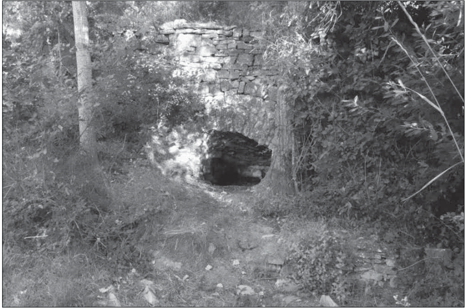
Font del Ferro.