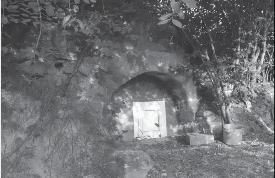
Font dels Oromins.

Encara queda una altra font en aquesta banda del torrent, però més lluny que les altres (a uns 2 km. del torrent). És al peu del camí de les Rapaldes i es coneix amb el nom de Font de Sant Antoni o Font Guitarda, molt a prop de la capelleta vora camí, dedicada a aquest sant. Aquesta capella abans era al costat esquerre del camí i quan van eixamplar els camins i havia d'anar a terra, la van posar a la banda de dalt. 4