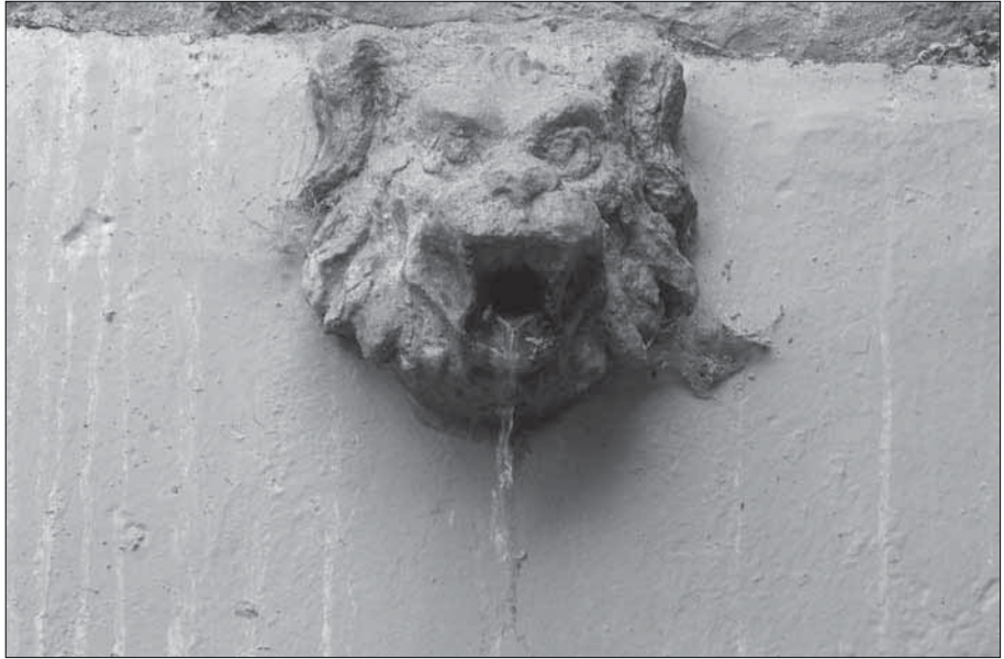
Sobreixidor de la Font de Fiol.

La font del Ferro, molt a prop de les altres dues, és la més cabuda d'aigua, degut a què el seu propietari sempre l'ha cuidat..