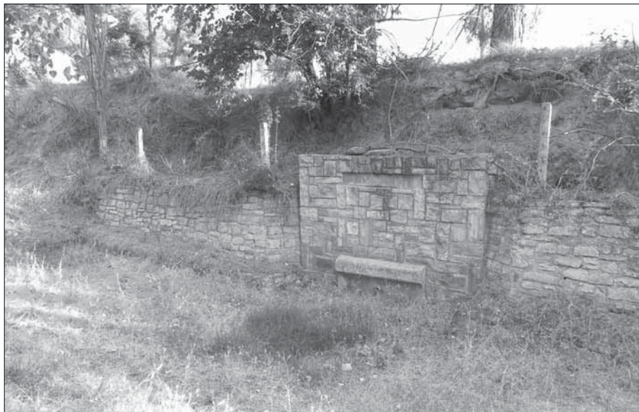
Font del Grau.

La Font de Capell a la partida de Capell i la font de Patserra, a Patserra, avui ambdues desaparegudes.