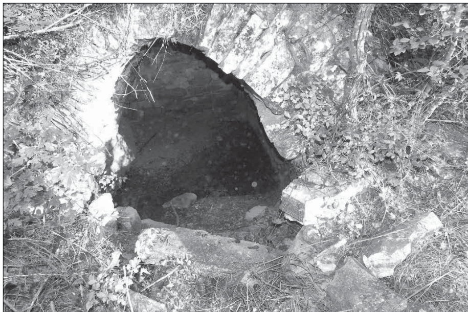
Font del Brial.

de Guissona, a la partida de Patserra, anomenada Font de Patserra. Aquesta també ha desaparegut, està enrunada.