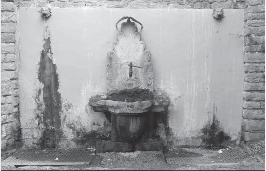
Font de Fiol (Fillol).

Tirant torrent avall hi ha la Font del Grau. Prop del torrent, abundosa per cert i també molt coneguda i visitada. Pertany a la partida de Santa Magdalena. 2