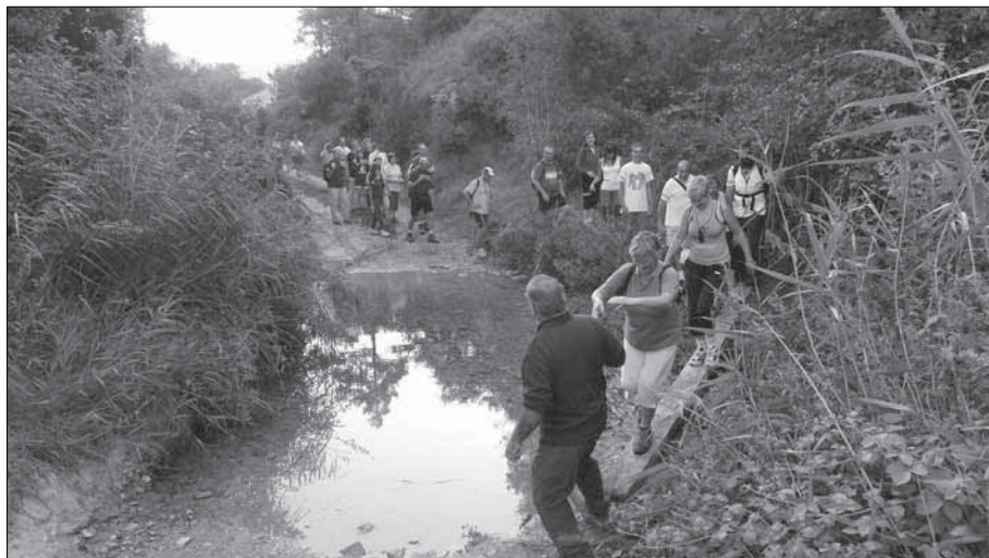
Passant el riu Gaià.