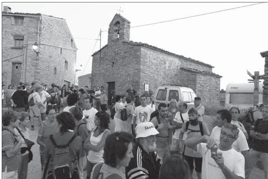
Sant Gallard.