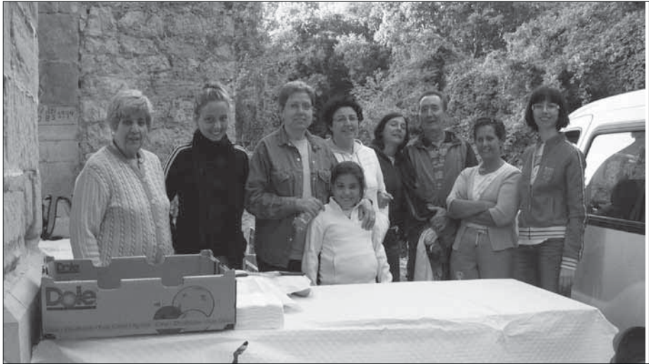
Part de l'equip d'intendència.