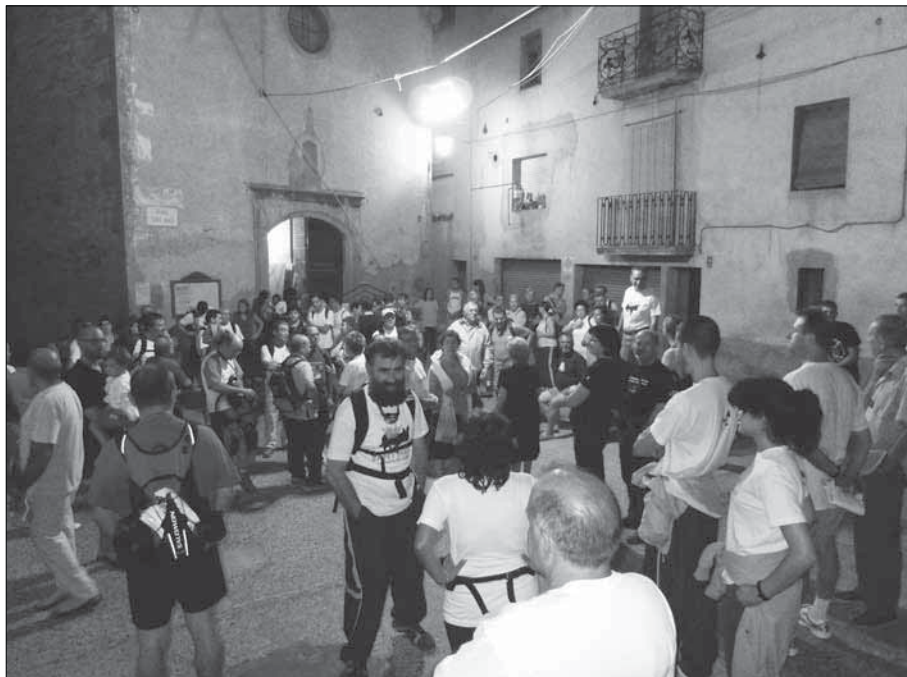
Inscripció a la caminada.

que acaba al ramal de la carretera de Pontils que ens portaria a Biure.