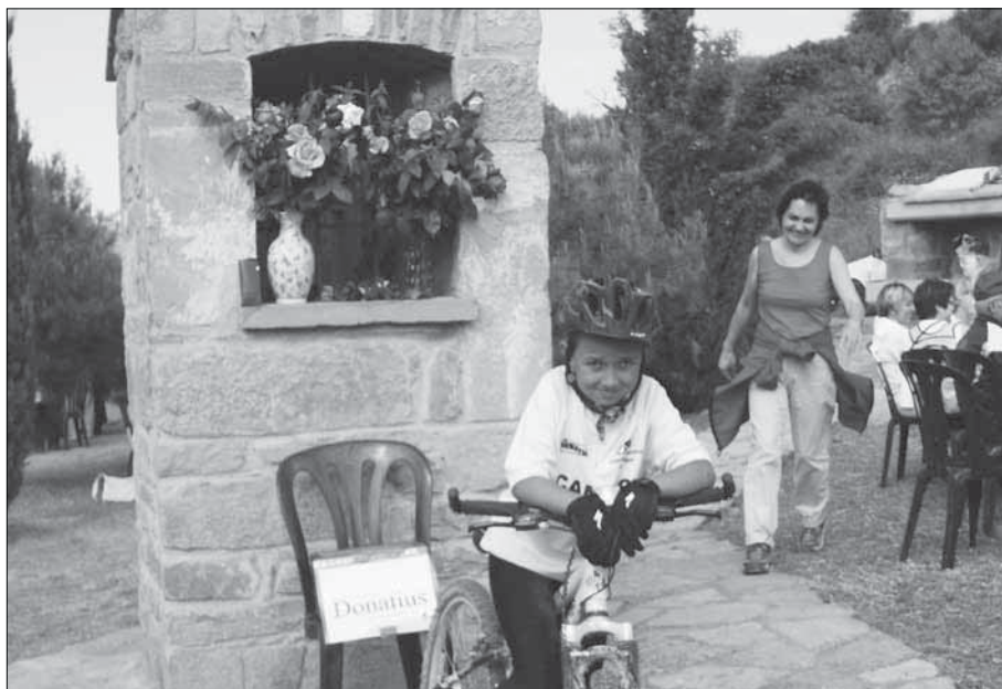
Compte, no tots caminaven, n'hi havia que pedalaven.