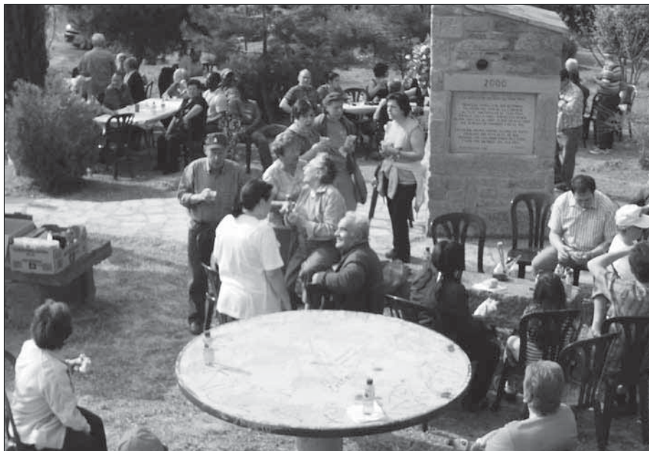
La gent està "disfrutant", de mil coses estan parlant.