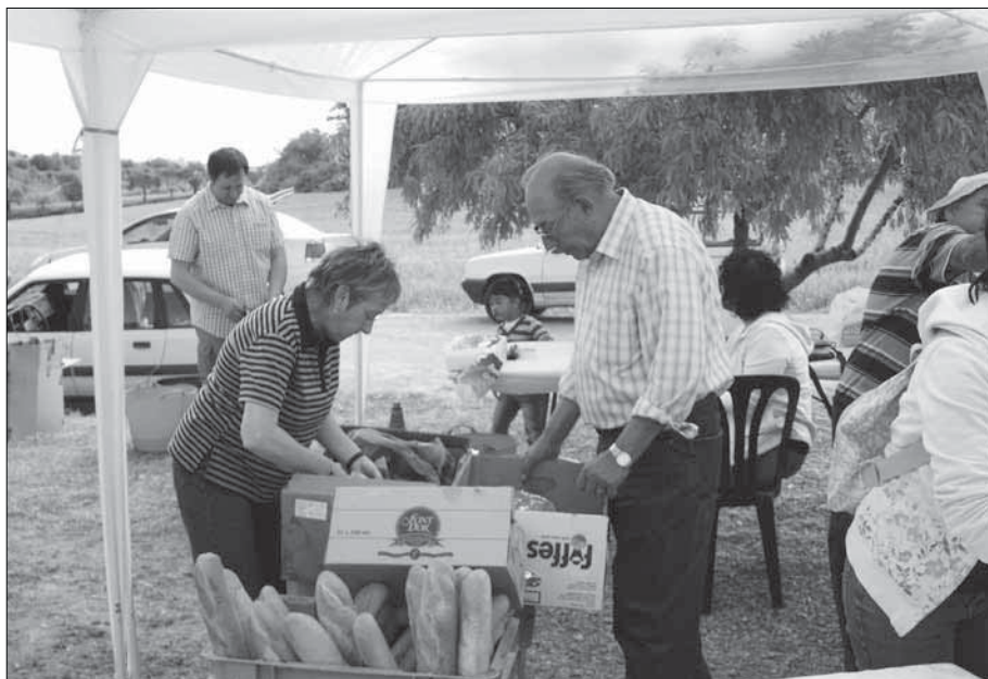
Els organitzadors diligents, procurant no falti res als "clients".