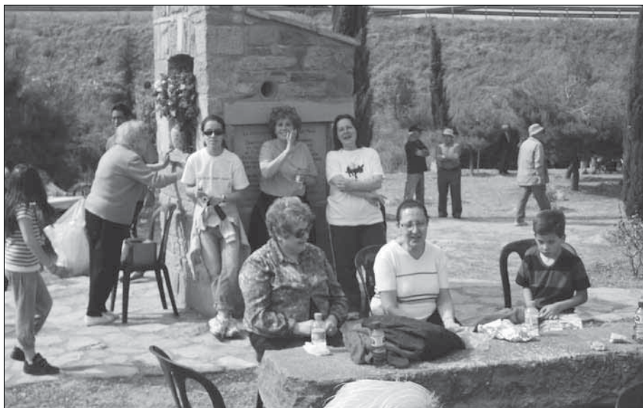
Amb tanta flor, algú s'ha de atansar, ja que a Sant Magí volen mirar.