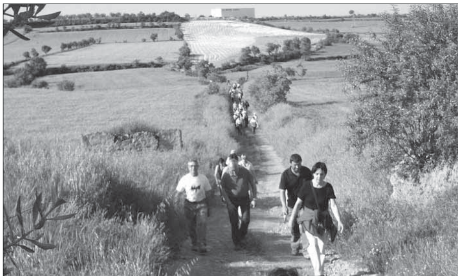
Caminant, caminant, pel camí anem pujant.