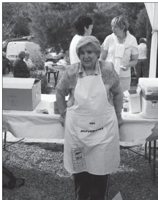
La Núria estrena davantal, en tot el món, no n'hi ha cap d'igual.