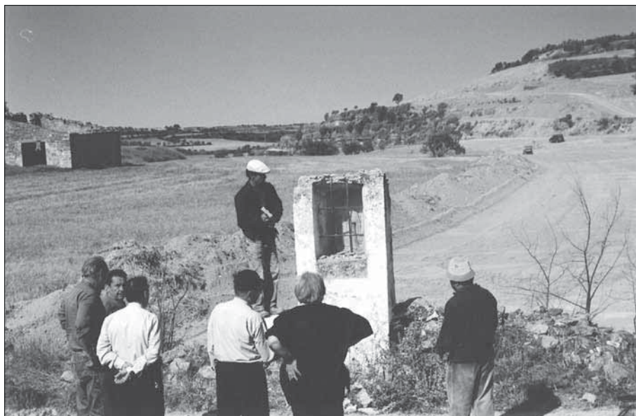
Desmuntant la capelleta.