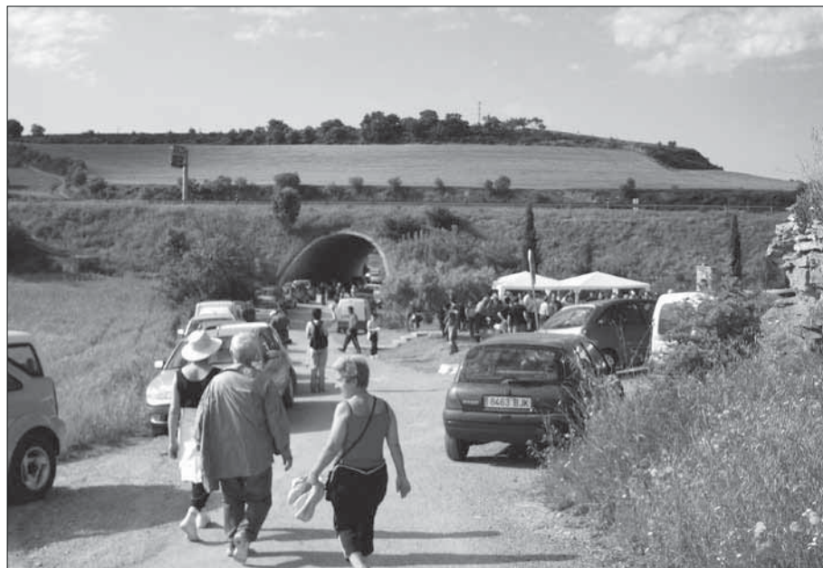
Per fi, ja hem arribat, l'aplec està començat.