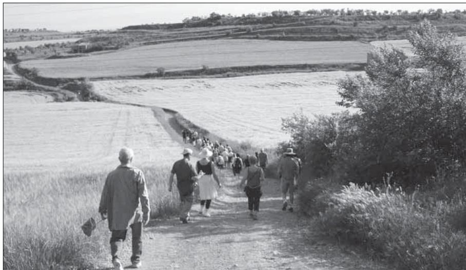
Caminant, caminant, pel camí anem passant.

Be, ja n’hi ha prou de xerrameca; tot seguit unes fotos dels esdeveniments.