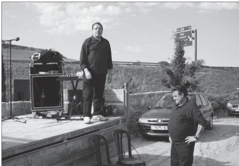
El Duet Alborada, preparant la cantada.