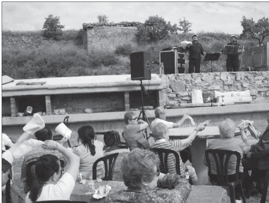
L'Alborada, al públic ha animat, estan tots amb el mocador aixecat.