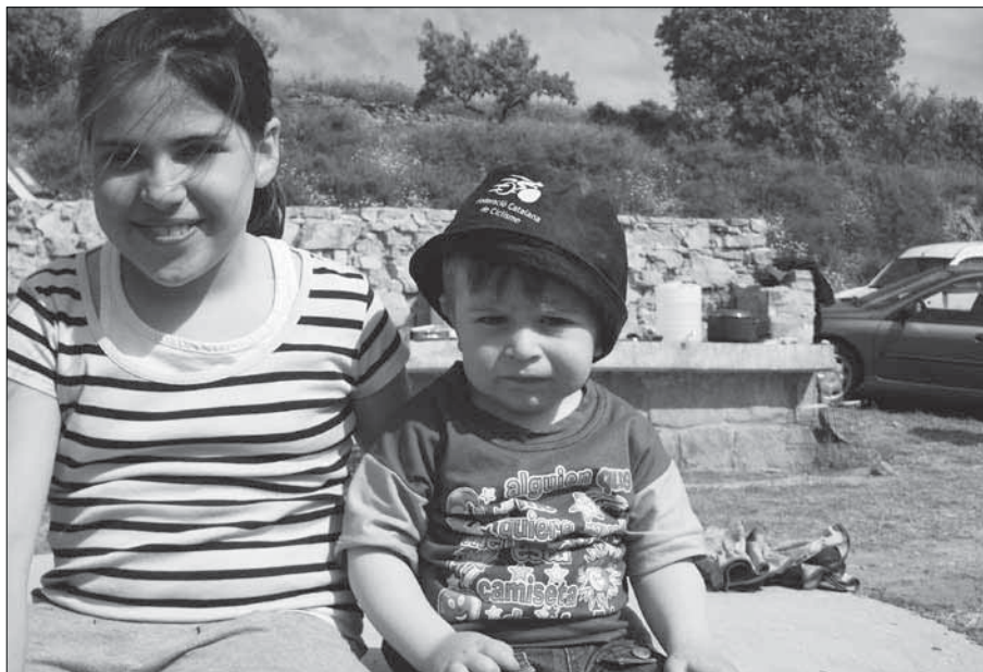
De vent petits els porten aquí, perquè s'aficionin a Sant Magí.