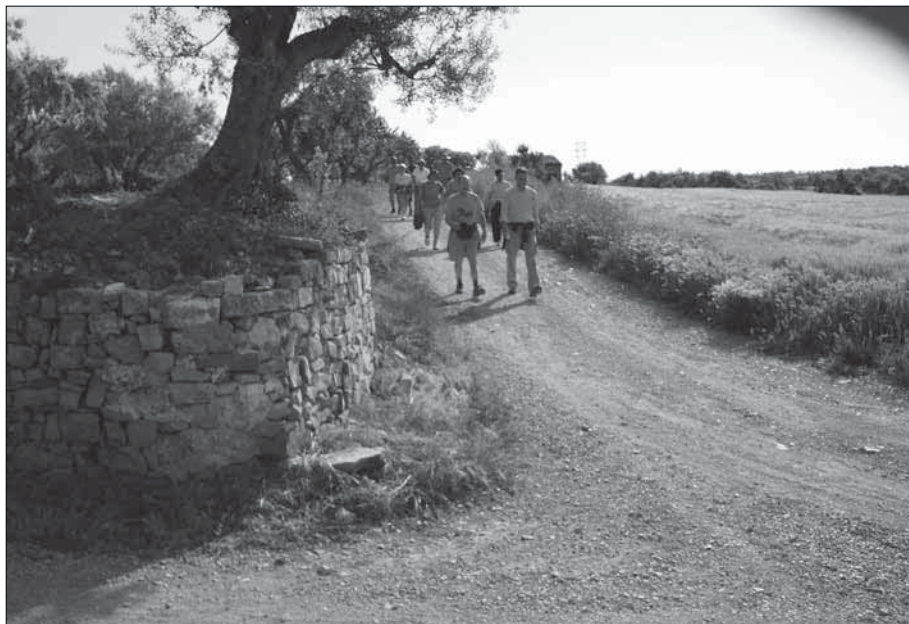
Cruïlla de la Cardosa, per arribar ja queda poca cosa.