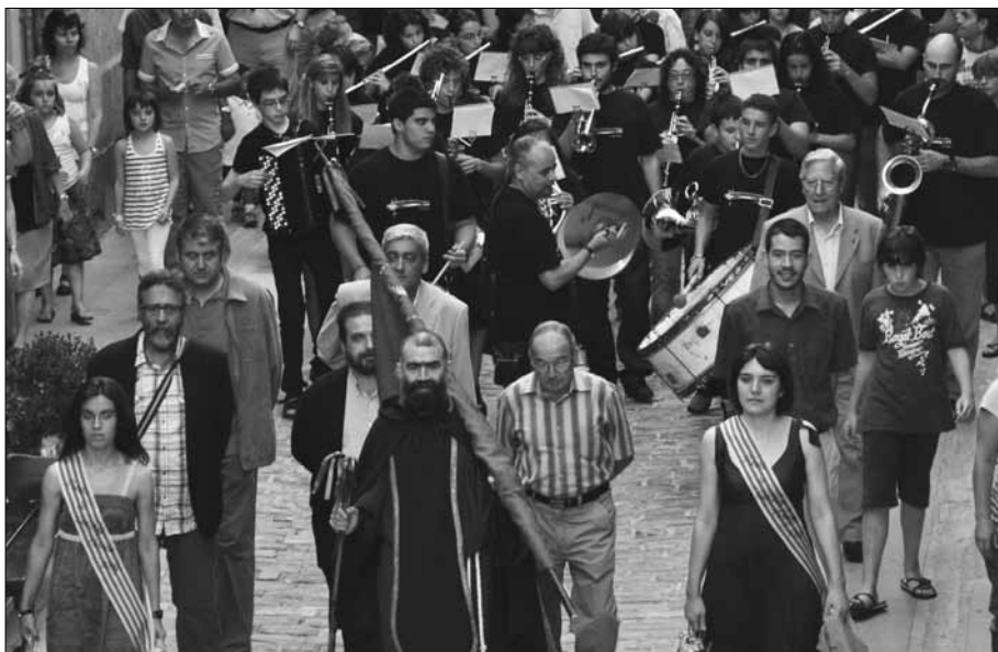
Comitiva de l'Entrada de l'Aigua.

part de l'Associació amb: una mida del Sant per posar al bridó, una botella del cava, una capsa de galetes i un número pel sorteig d'un pernil. A la llista hi cal afegir els dos tiquets per l'esmorzar de la Brufaganya i un pel sopar de Sant Magí a la plaça Major.