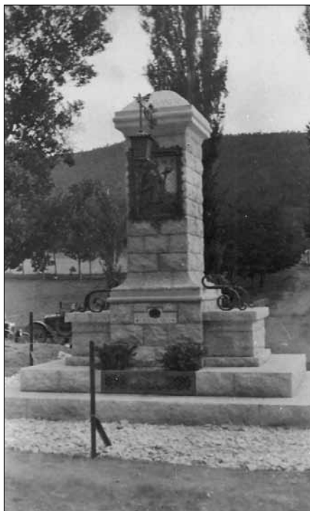
El Pedrò d'Igalada a Sant Magí de la Brufaganya.

Els dies 26 i 27 de juny es va celebrar el 4rt. Aplec de la Capelleta de Sant Magí