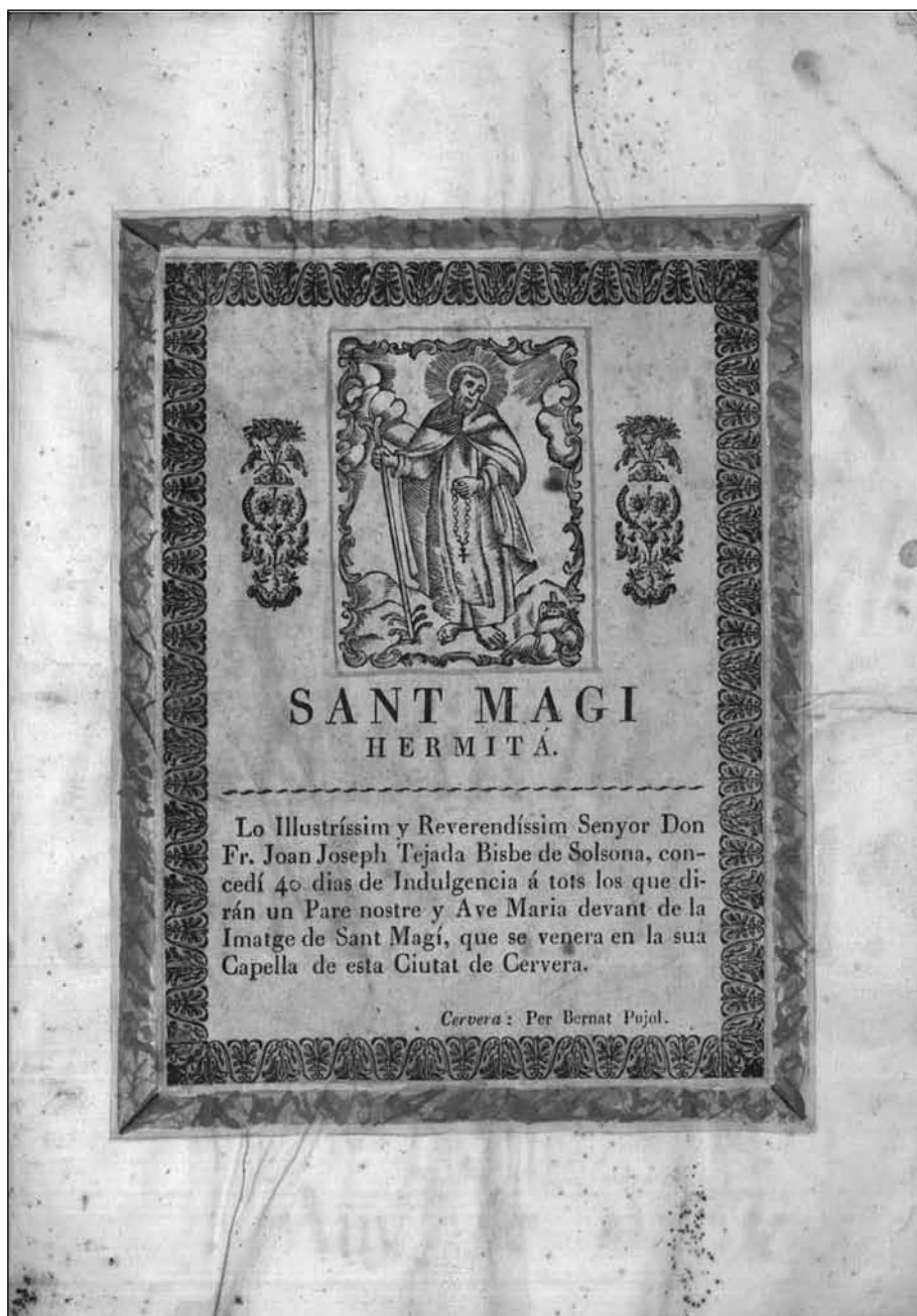
Estampa enganxada a la primera pàgina del llibre.