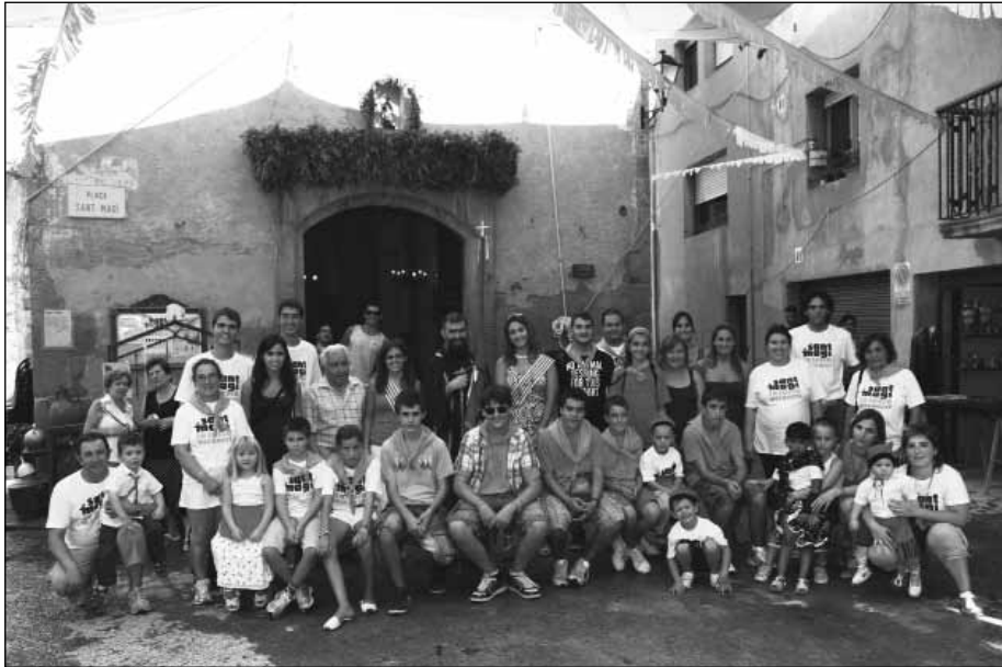
Grup de repartidors.

El diumenge dia 27 de maig hem celebrat el 12è. Aniversari de la reconstrucció de la Capelleta del Clot de Sant Magí. Amb la tradicional caminada i tirada de bitlles.