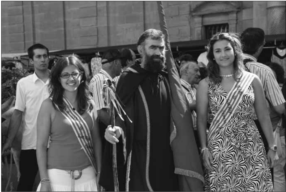
Repament de l'aigua en dia de mercat.

com a Coques musicades . L'adjudicatari té dret a triar el tipus de música, ritme o cançó i també qui pot ballar i qui no. Actualment hi afegim: que la persona o grup a qui es vulgui fer ballar, hi estigui d'acord.