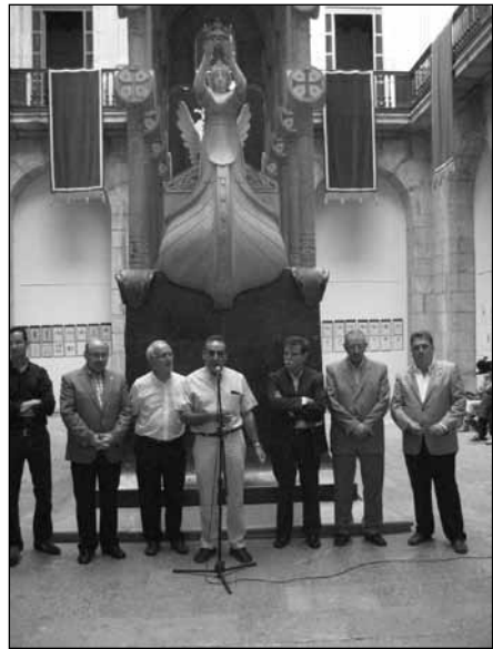
Inauguració exposició a Tarragona.

Com que el Quadern és obert a tothom per publicar un escrit en record a familiars i amics, la Junta ha cregut