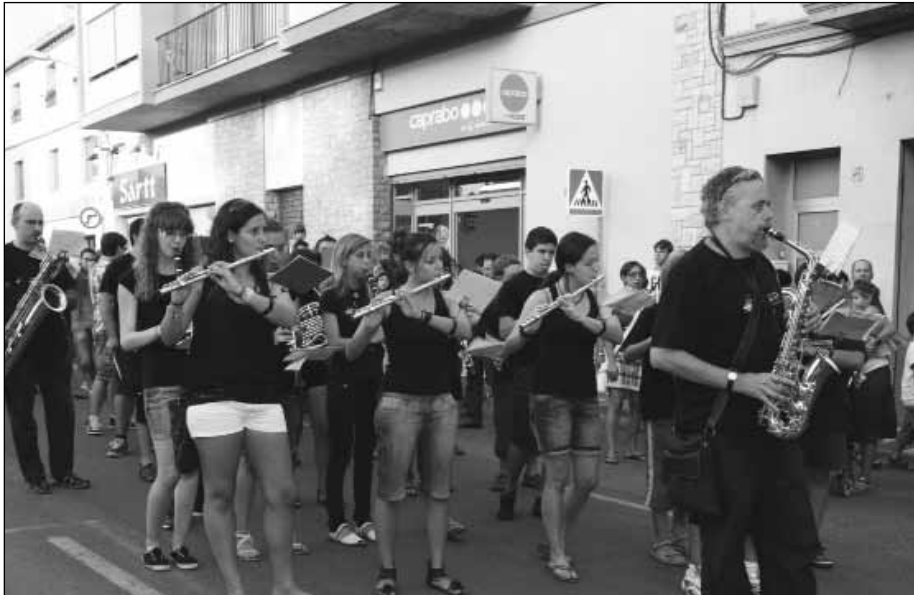
Grup de vent del Conservatori de Música de Cervera.

de les Associacions de Salut Mental Alba i Ondara Sió.