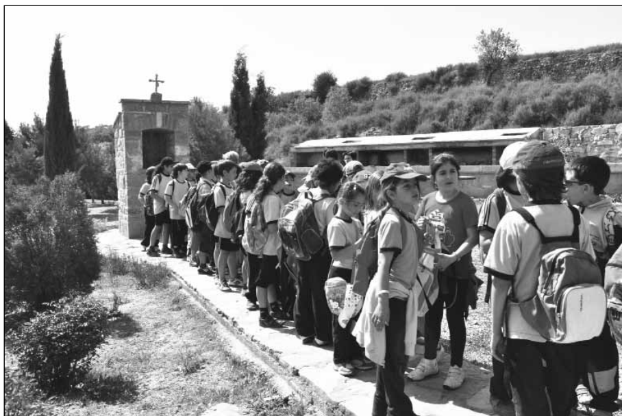
Alumnes de l'escola Jaume Balmes.

Cóssos, el grup Sound de Secà, ens ha obsequiat amb una cercavila pels carrers del barri.