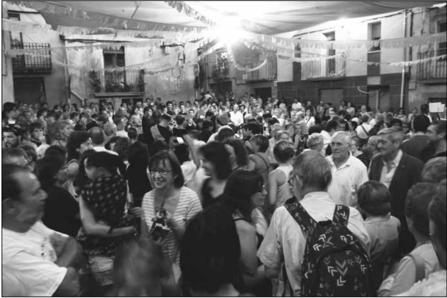
Arribada a la placeta de Sant Magí.