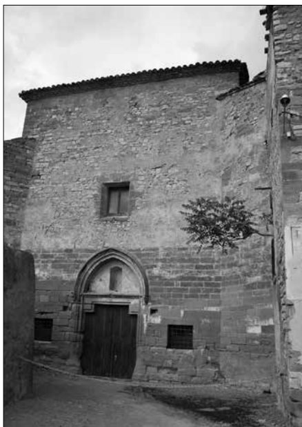
Església de Sant Francesc.