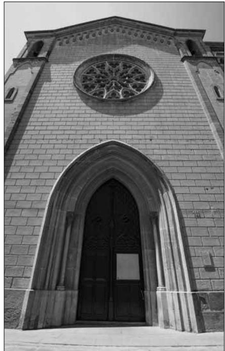
Església de Sant Agustí.