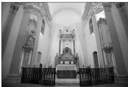
Església de la Companyia.