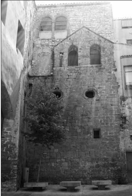
Església de Sant Joan degollat.

Celebració de sant Joan Baptista, en la festa del seu martiri (29 d'agost). Profeta. Precursor del Senyor. Batejà a Crist. Apart dels membres de la Sagrada Família, no ha nascut de dona ningú més gran que sant Joan Baptista.