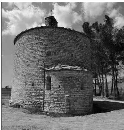
Església de Sant Pere el Gros.

Festa de sant Pere (festa litúrgica de sant Pere i de sant Pau (29 de juny)). Sant Pere: príncep dels Apòstols, roca sobre la que està edificada l'Església, primer sant pare de l'Església catòlica. Màrtir.