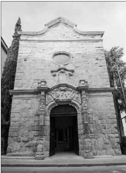
Església de Sant Antoni.