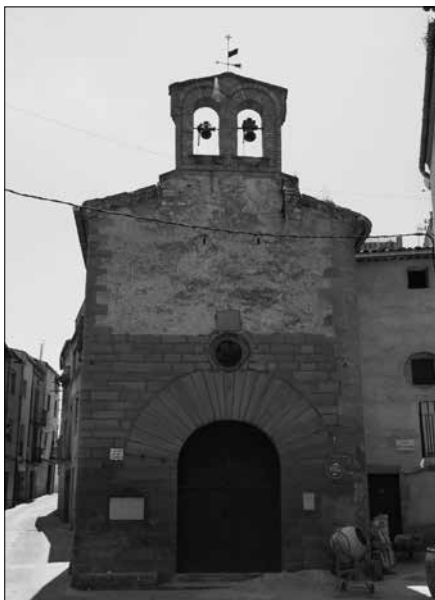
Església de Sant Cristòfol.

Sant Cristòfol (10 de juliol): nasqué al segle III a Fenícia. El seu nom significa portador de Crist. Fou màrtir. És patró dels automobilistes.