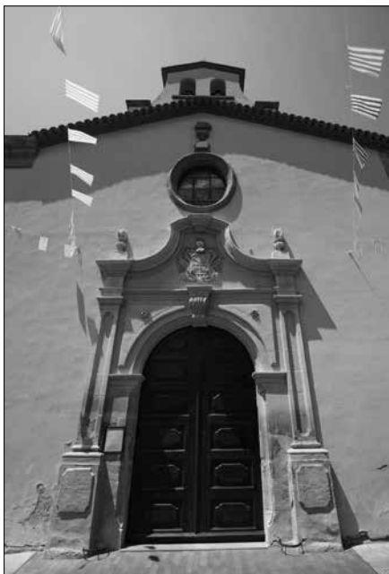
Església de l'Hospital.

S'hi celebra la Mare de Déu del Carme (16 de juliol). Advocació mariana molt relacionada amb l'escapulari del Carme.