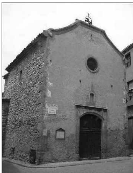
Església de Sant Magí.

“Hom ha cregut que (sant Magí, màrtir) fou un asceta del segle III que menà vida solitària a la serra de la Brufaganya, al nord-oest de Tarragona” (Litúrgia de les hores,