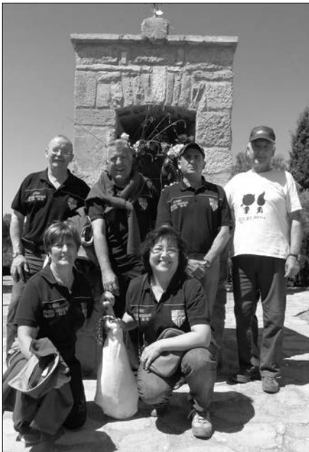
C.B. Barri Ametllers.

es va celebrar el 15è Aniversari de la reconstrucció de la Capelleta del Clot de Sant Magí. La Nati Gutiérrez, va dissenyar el cartell amb una fotografia de l'anterior Capelleta i una altra de l'actual, amb la descripció de les activitats (caminada, esmorzar i tirada de bitlles) i al peu els logos de les entitats col·laboradores: Paeria de Cervera, de la Parròquia de Cervera, del Centre Excursionista de la Segarra, dels Grups de Bitlles i dels Veïns de la contrada. Un any més, a l'obrir el paquet de la llonganissa de la Xarcuteria Vilà, hi trobem el detall d'un paquet complementari. El premi de la tirada de bitlles era un pernil, i l'han disputat els següents equips: Barri del Ametllers, C.B. Malgrat, Los del Huerto, C.B. Cervera, C.B. Tordera, i C.B. Vergós. El guanyador va ser l'equip del Barri del Ametllers. Entre tots els inscrits vam sortejar un