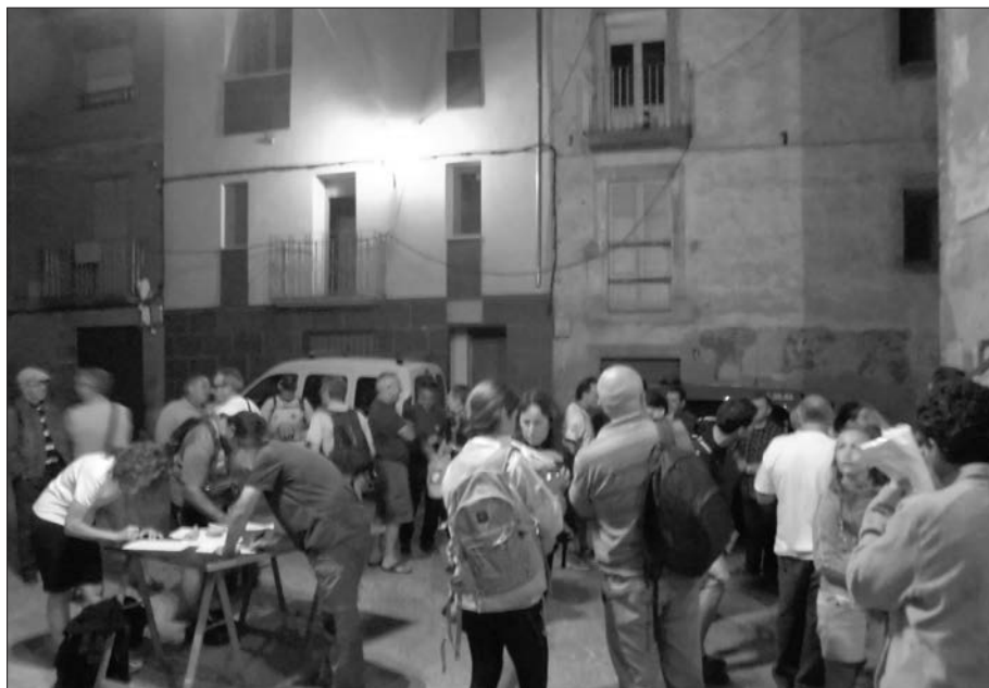
Inscripcions per a la Marxa a la Brufaganya.

- Ha sortit notícia de la Festa als diaris: Segre, La Mañana, La Veu de la Segarra, Segarra Actualitat, Tàrraga TV, Lleida TV i a Televisió de Catalunya TV3.