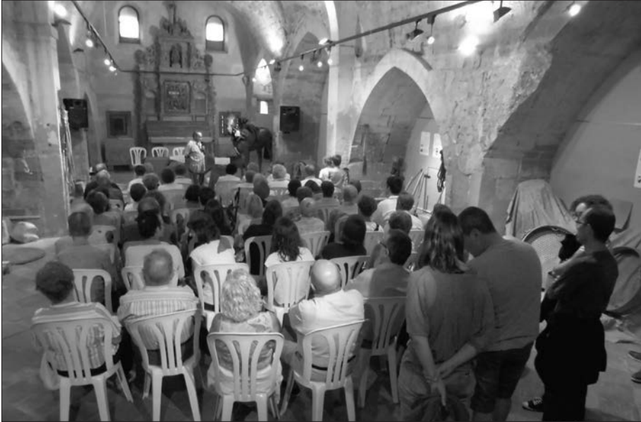
Inauguració de l'exposició.

Una dotació de la Policia Municipal ens ha acompanyat durant tot el recorregut. Un equip de neteja de la Paeria, s'ha encarregat de deixar-ho tot net.