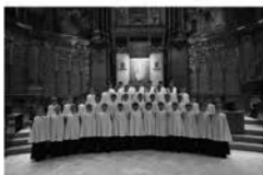
Escolania de Montserrat

Divendres , 17 de juny, 21:30 h. Santuari de Sant Magí de la Brufaganya