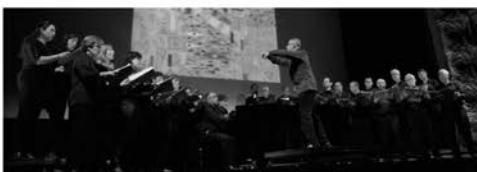
Coral Mixta d'Igualada

Dissabte, 13 d'agost, 21:30 h. Santuari de Sant Magí de la Brufaganya