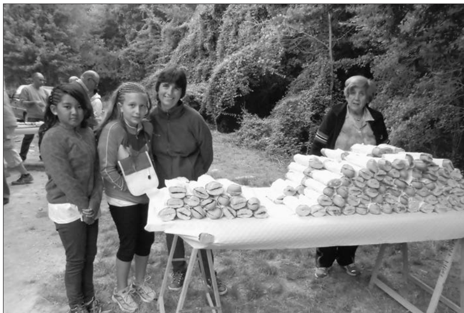
A punt de servir.

La inscripció era a 10 € i es cobrava un suplement de 3 € a qui volgués tornar en autocar. El tiquet, amb les bases de participació i numerat, donava dret a esmorzar, a la samarreta de record i a participar en el sorteig d’un pernil.