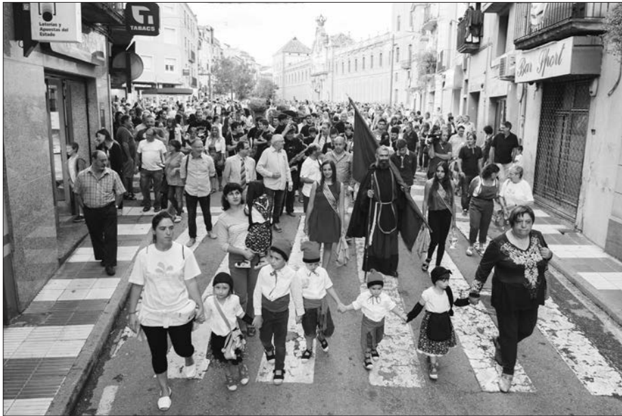
Entrada de l'Aigua.