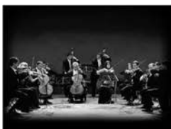
Orquestra de Cambra Camerata XXI

Divendres , 17 de juny, 21:30 h. Santuari de Sant Magí de la Brufaganya