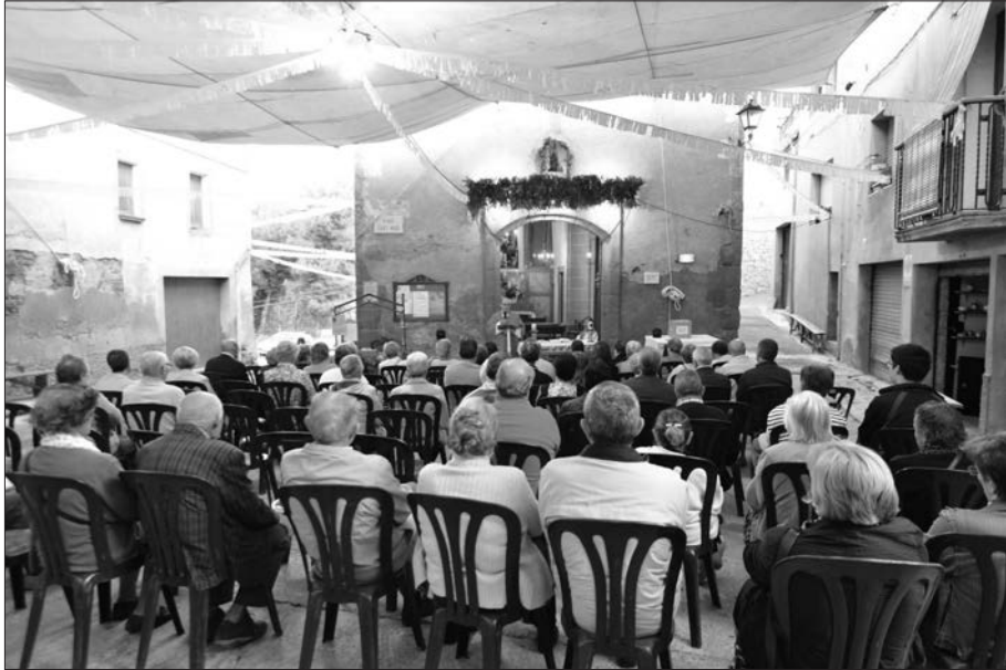
Missa a la placeta el dia 18 d'agost.