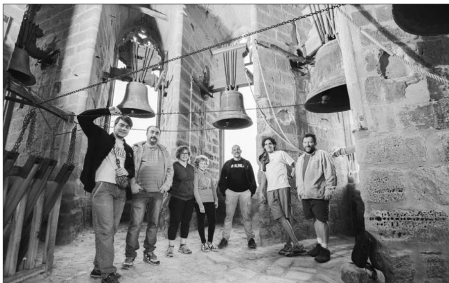
Dalt del Campanar.

la col·laboració i la bona predisposició de tothom.