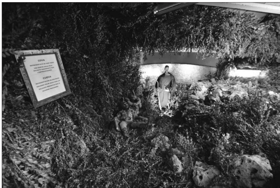
La Cova.