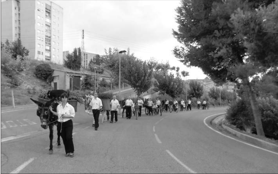
Corrua de Portants.

per a l'esmorzar. El pa de la Fleca Vilarrosa, fuets, formatge, tomàquets i els estoigs de pernil, ja tallat, que un any més hem trobat pagats! Moltíssimes gràcies!