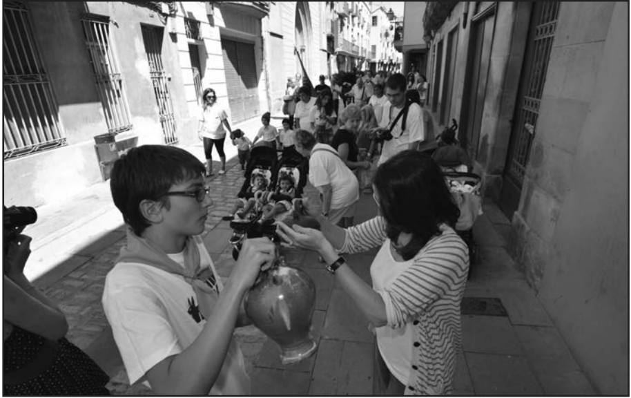
Repartiment de l'Aigua.

La Victòria Fusté ha acabat la restauració del retaule de fusta del cambril.