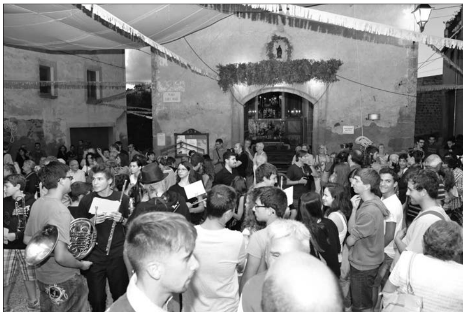
Placeta de Sant Magí.

Al no fer el sopar, tampoc hi ha hagut pregó, ni pubilles, ni "Magnet" de l'any, ni ball de la coca, totes aquestes activitats estaven pensades per recuperar la part de la Festa que s'havia fet a la plaça Major.