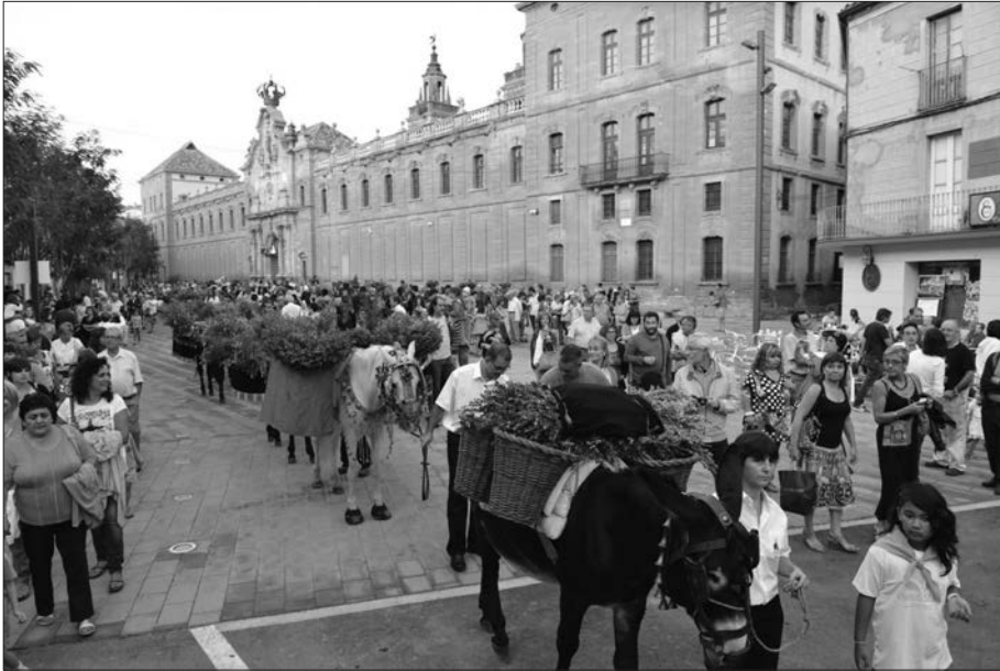
Càrrega de dol.