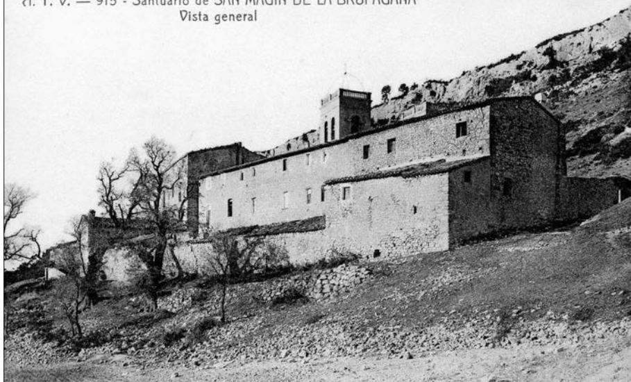
A. T. V. — 915 - Santuario de SAN MAGIN DE LA BRUFAGAÑA Vista general

se toca les dos campanes juntes ab modo trist ... sens bogarles (bongar, brandar), per ser esto reservat per los Obits (per les altres morts)” .