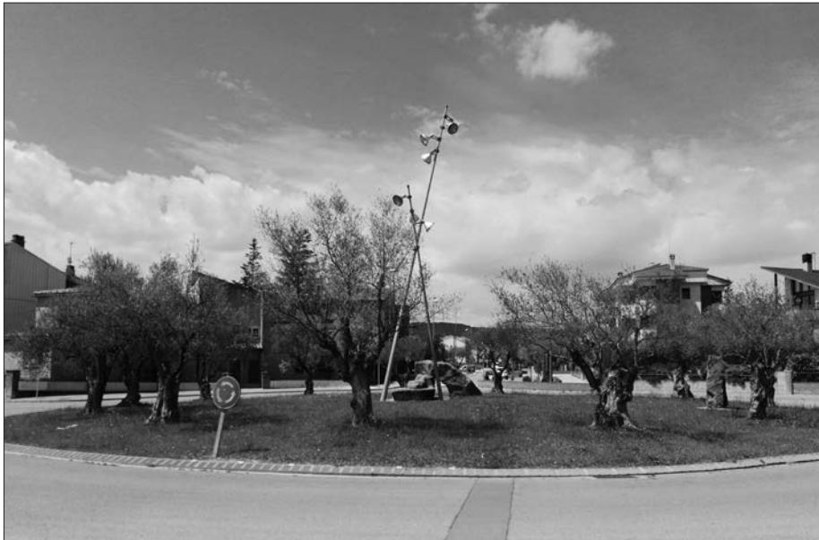
Fig. 1. Plaça del Turó de Sant Magí.

Palomino f 3 (Palomino fecit), fet per a l'obra Atlante Español 4 , de D. Bernat Espinalt y García 5 , Madrid, 1783, de