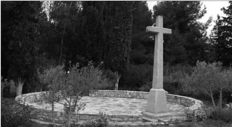
Espai martirial de Mas Claret