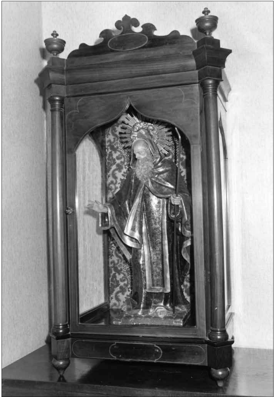
Fotografia: AFMI11002.JPG. AFMI 11002. Data: 1989-01-21. Imatge de Sant Magí.