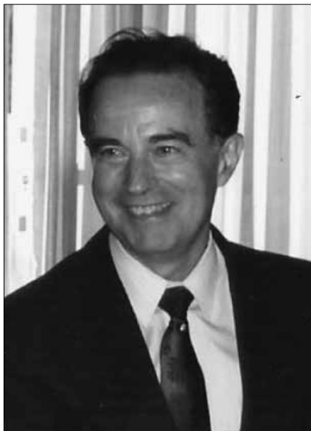
Magí Puig i Gubern.

anomenades dels ametllers. La cova del mig, meitat del terme d'Igualada meitat d'Òdena, fou la que elegí el devot ermità per estatge. En ella, i davant d'una creu feta de troncs d'arbre, passava hores i hores agenollat, fent penitència. Dormia a terra, recolzant el seu cap en una pedra. Sortia de la cova per ensenyar als infants la doctrina cristiana, i predicava a la gent en places i llocs públics no sols d'Igualada sinó també dels pobles veïns. Anava així mateix a atendre els malalts a l'Hospital de Sant Bartomeu, als quals proporcionava un gran consol espiritual. Tothom coneixia la seva virtut i escoltava les seves exhortacions. L'anomenaven Germà Joan. Se'l respectava i se l'apreciava. Al cap d'uns anys de residir a Igualada, el bon ermità es traslladà a Barcelona per tenir cura dels malalts de l'Hospital del Rei. A la ciutat comtal va morir rodejat d'una aurèola de santedat. Les seves despulles foren inhumades al Monestir de Jesús dels P. Observants de Sant Francesc 1 .