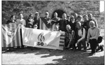
50 anys de la Renovació de la Flama de la Llengua. SEAS, febrer 2019

excursionista li hagi demostrat sempre un agraïment etern. L'any 1968, centenari del seu naixement, els excursionistes catalans li van retre un homenatge que consistí a portar una flama encesa des del Canigó, al peu de la seva tomba a Prada de Conflent, fins a Montserrat, com a símbol de la llum aportada pel filòleg excursionista, flama que es renova fidelment el mes de febrer de cada any.