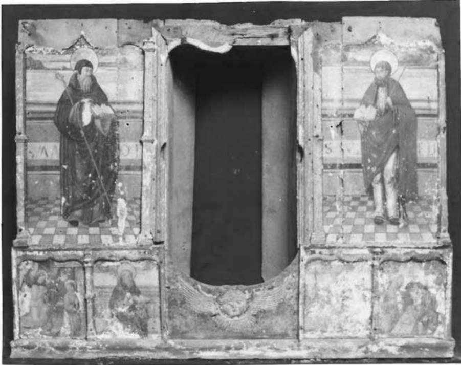
Retaula que hi havia a l'ermita de la Salut.

la relació entre els assistents, molts d'ells responsables de projectes relacionats amb Sant Magí de la Brufaganya i altres centres culturals de Copons, Cervera, Barcelona, Igualada, Tarragona i Santa Coloma